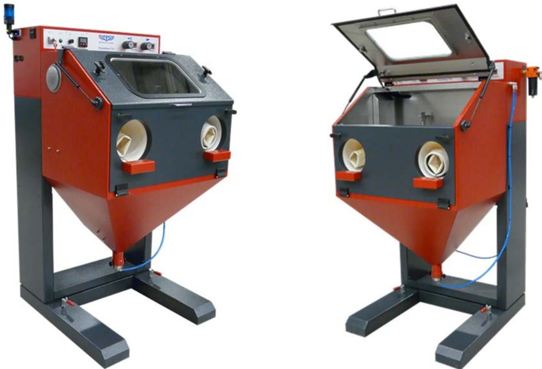
Abbildungen können Zubehör und / oder Spezialausführungen enthalten