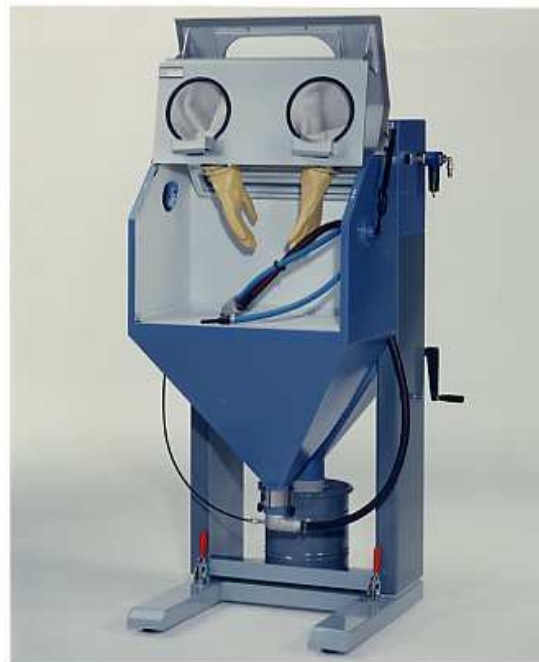
Abbildungen können Zubehör und / oder Spezialausführungen enthalten